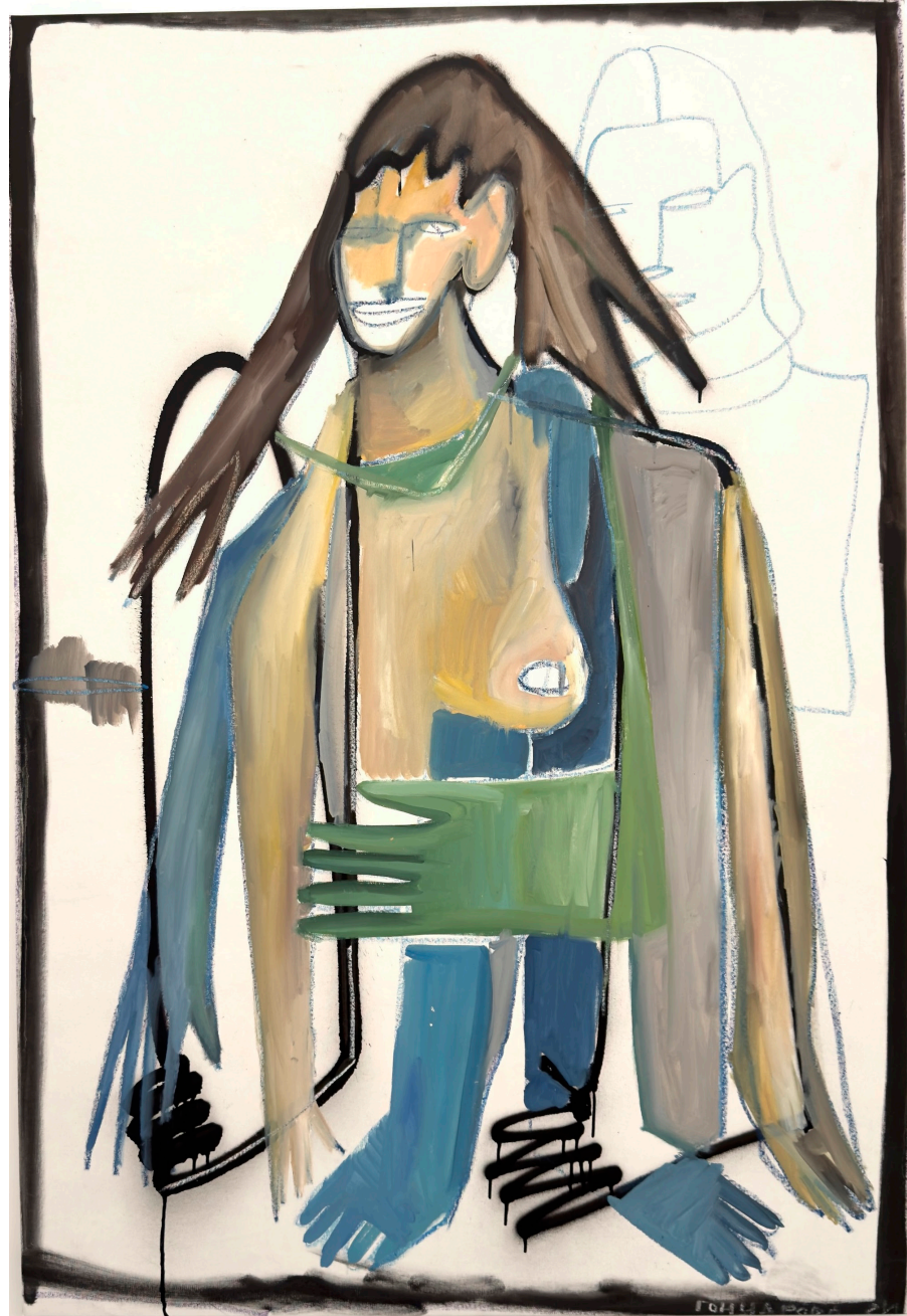
NTSHSH. Synthèse, 2024, huile et pastelles grasses et bombe sur toile, 151x104 cm