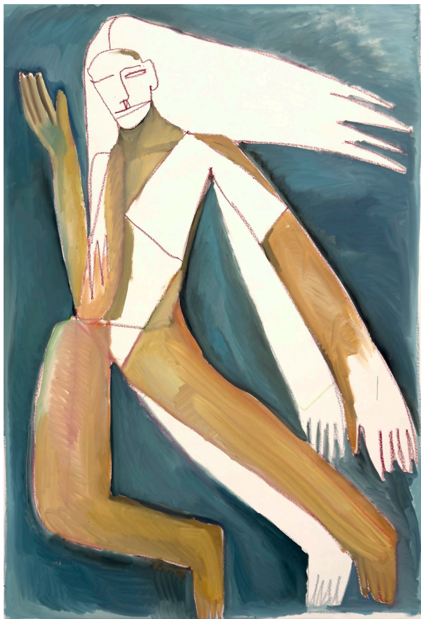
Sans Titre, 2024, huile et pastelles grasses sur toile, 150x103 cm