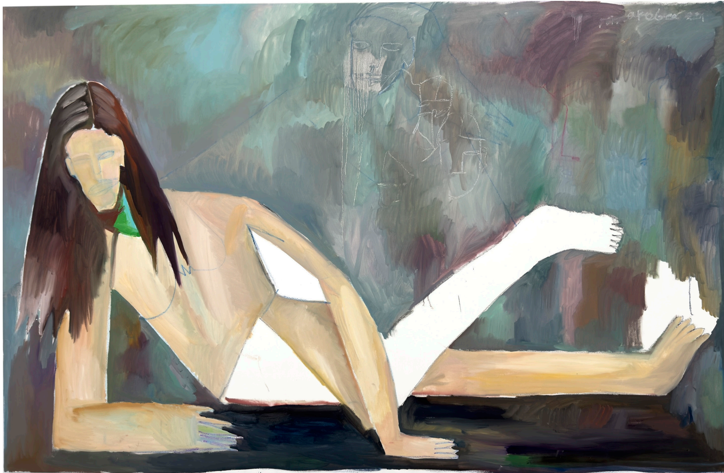
Olympia, 2024, huile et pastels grasses sur toile, 147 x 226 cm