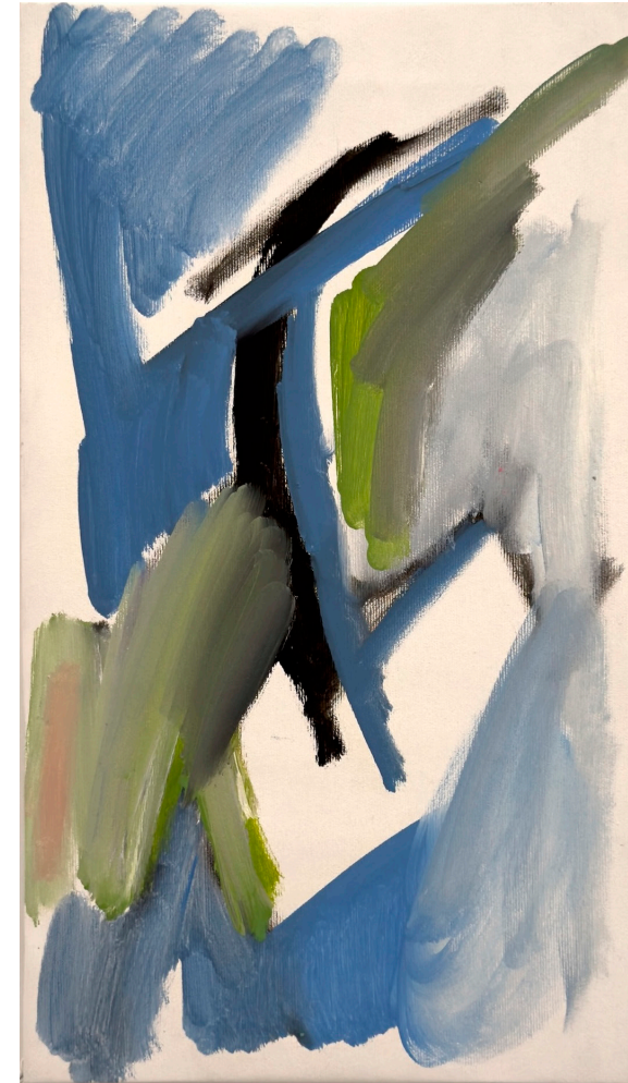
Petite Abstraction 01, diptyque 2024 huile et pastelles grasses sur toile 47x27cm