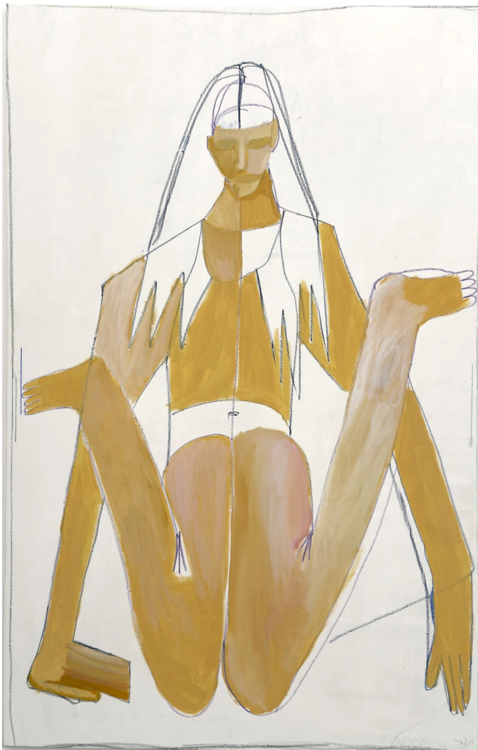
NTSHSH. L'été, diptyque, 2024, huile et pastelles grasses sur toile, 195x124 cm