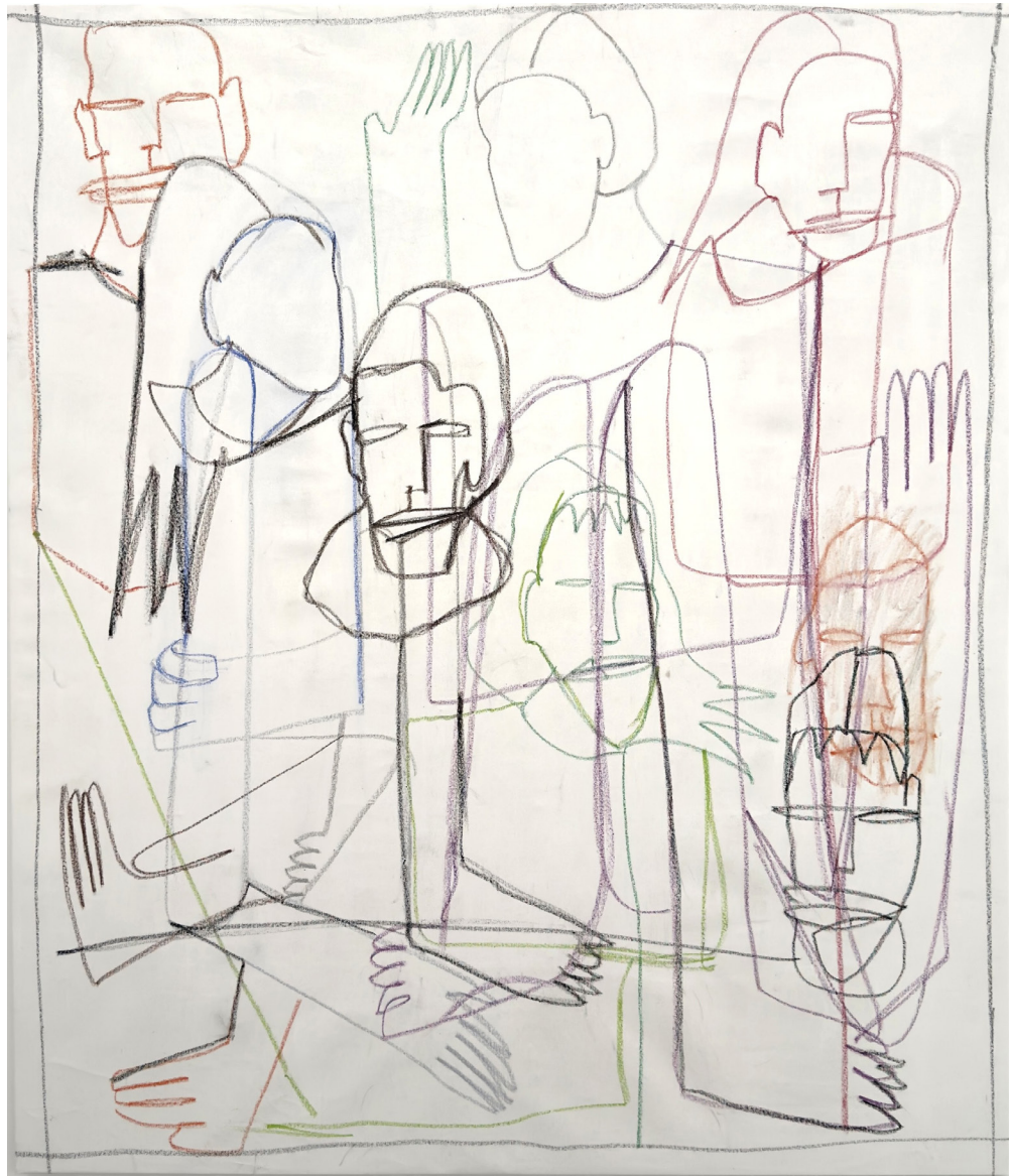
Effet de l'Éruption Solaire sur Manhattan, diptyque, 2024, huile et pastelles grasses sur toile, 152x130 cm