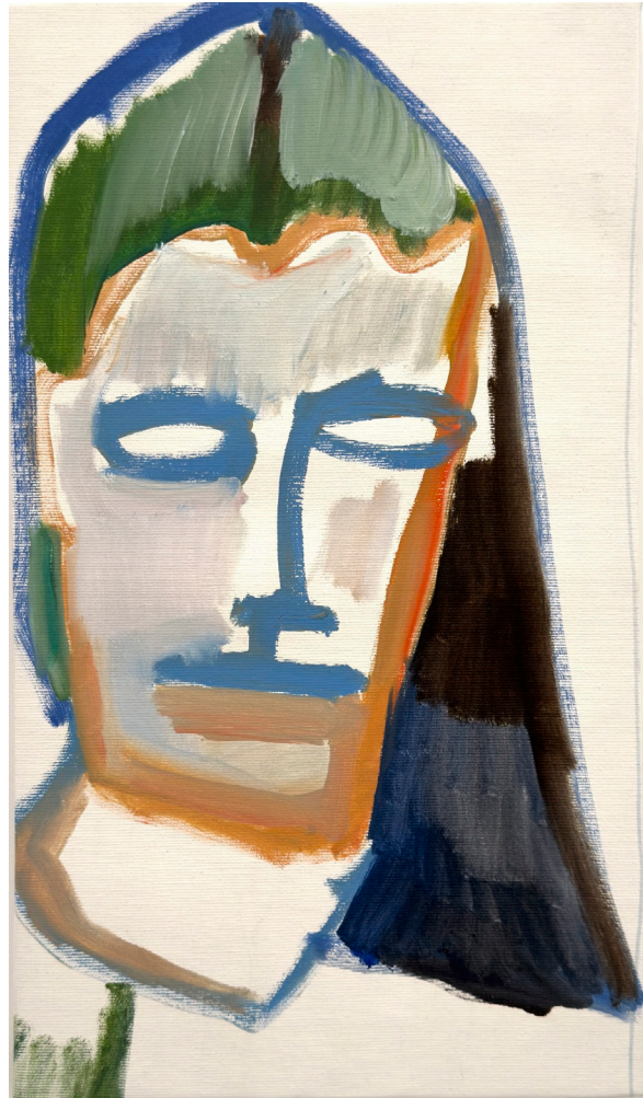
Petit Portrait 01, diptyque 2024 huile et pastelles grasses sur toile 47x27cm