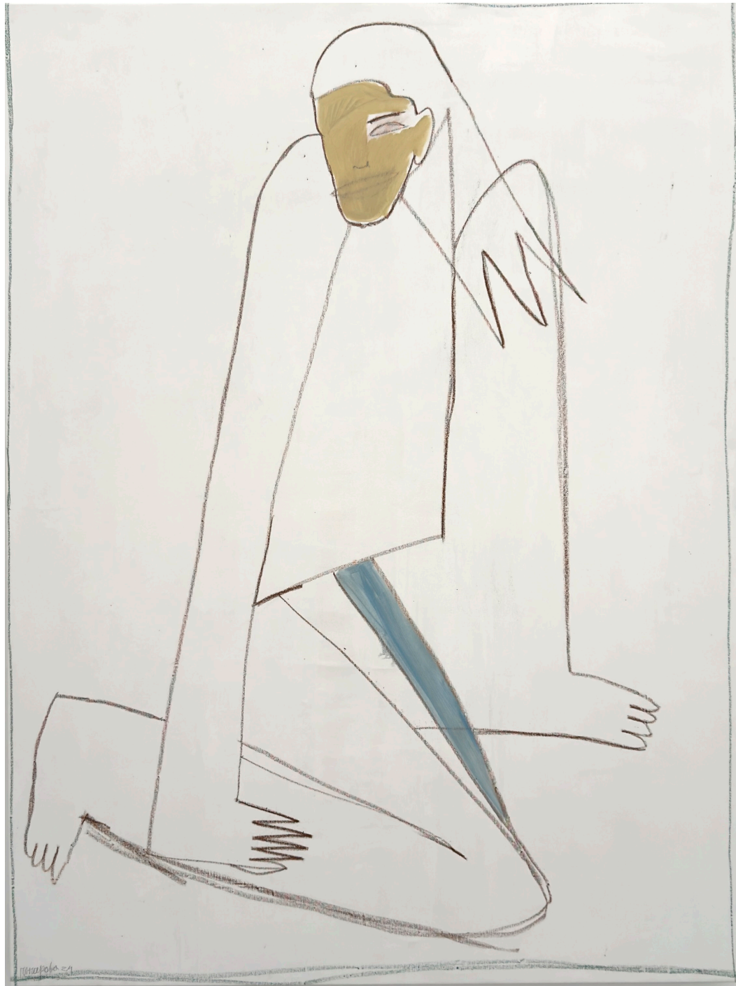
NTSHSH. Le Printemps, diptyque, 2024, huile et pastelles grasses sur toile, 155x116 cm