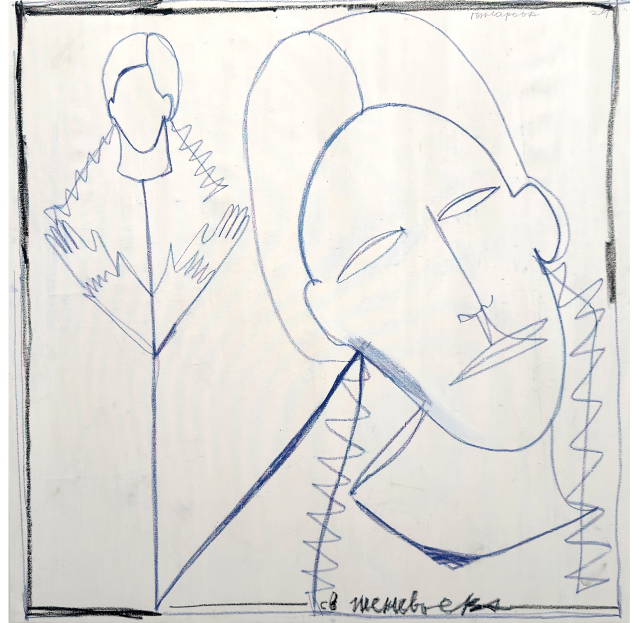
Sainte Geneviève, 2024, huile et pastelles grasses sur toile, 155x155 cm