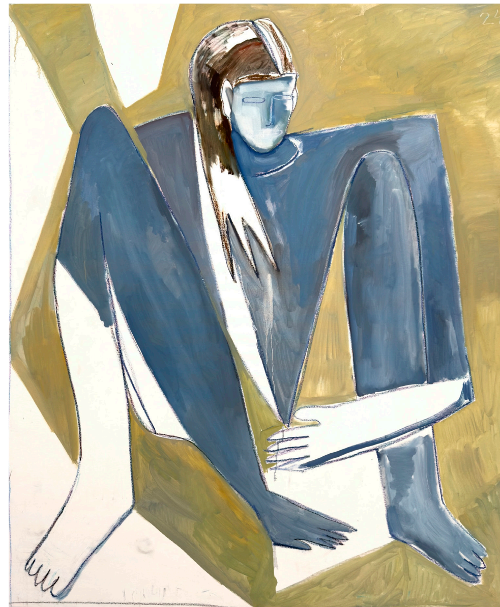
NTSHSH. Statique, 2024, huile et pastelles grasses sur toile, 180x150 cm