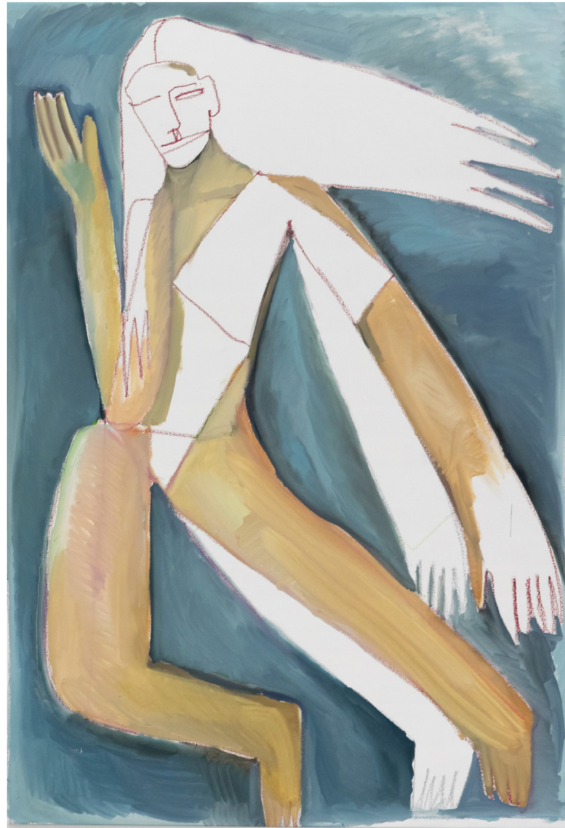
Sans Titre, 2024, huile et pastels gras sur toile, 150x103 cm