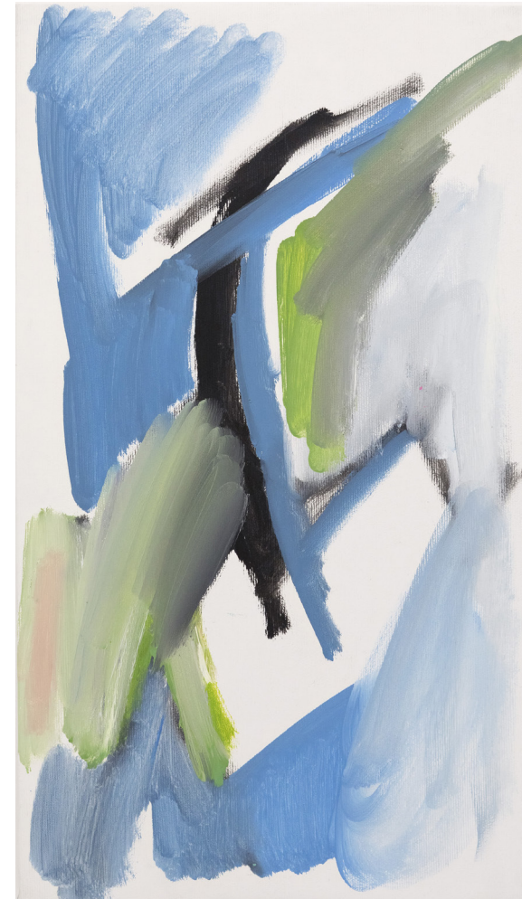
Petite Abstraction 01, diptyque 2024 huile et pastels gras sur toile 47x27cm