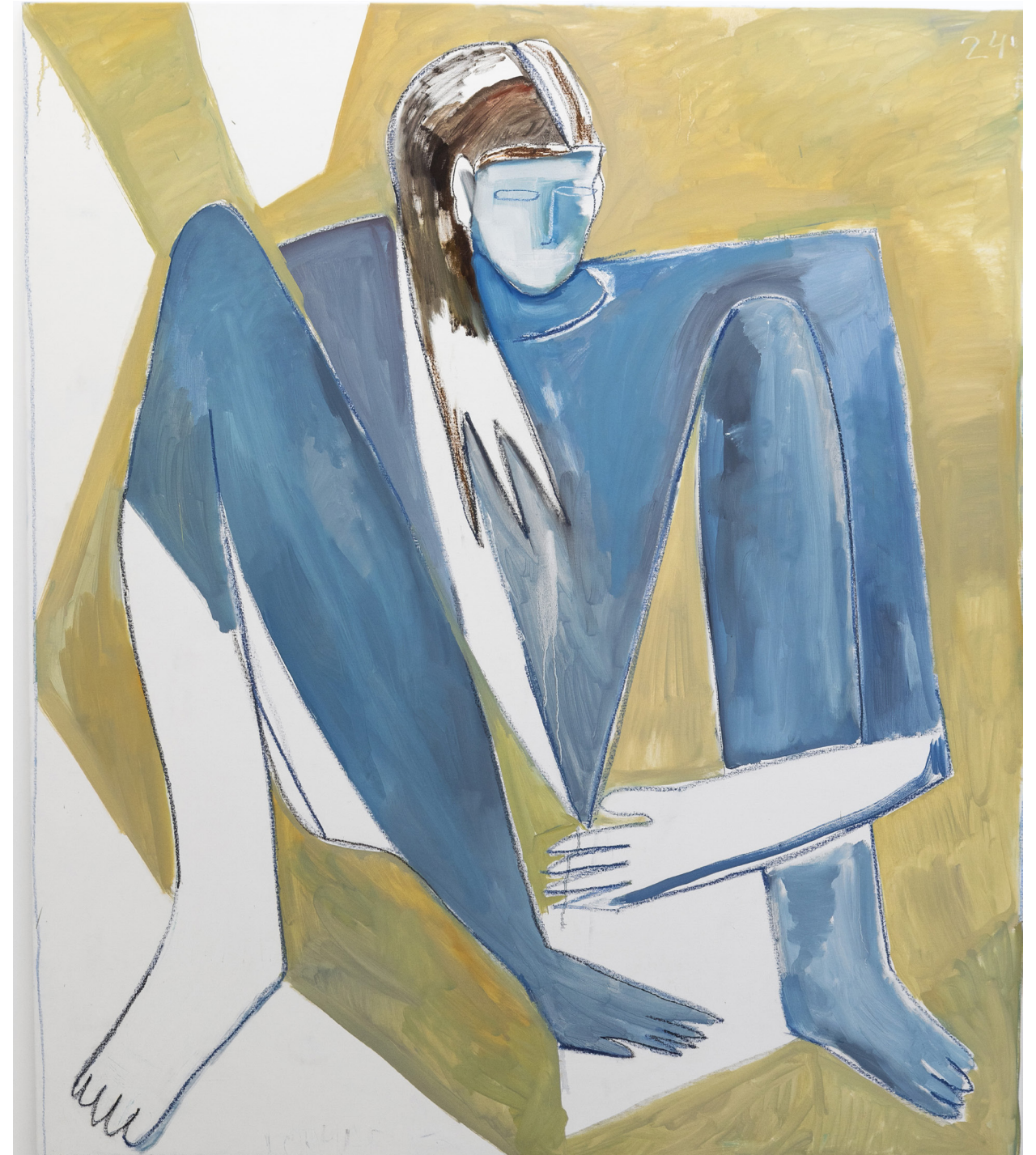
Statique, 2024, huile et pastels gras sur toile, 180x150 cm