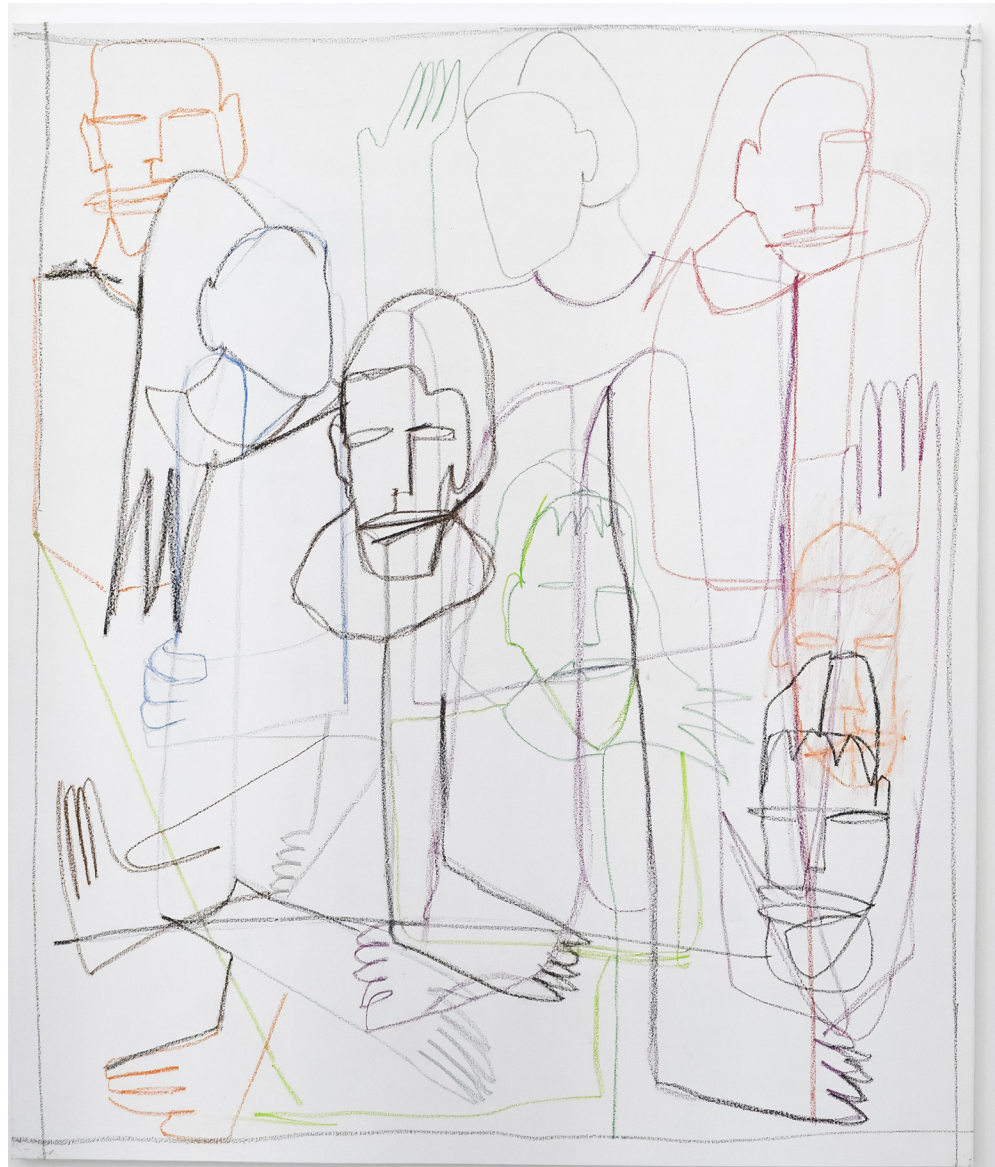
Effet de l'Éruption Solaire sur Manhattan, diptyque, 2024, pastels gras sur toile, 152x130 cm