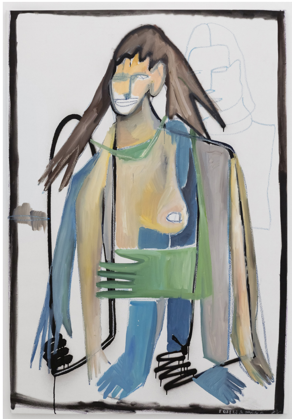
Synthèse, 2024, huile et pastels gras et bombe sur toile, 151x104 cm