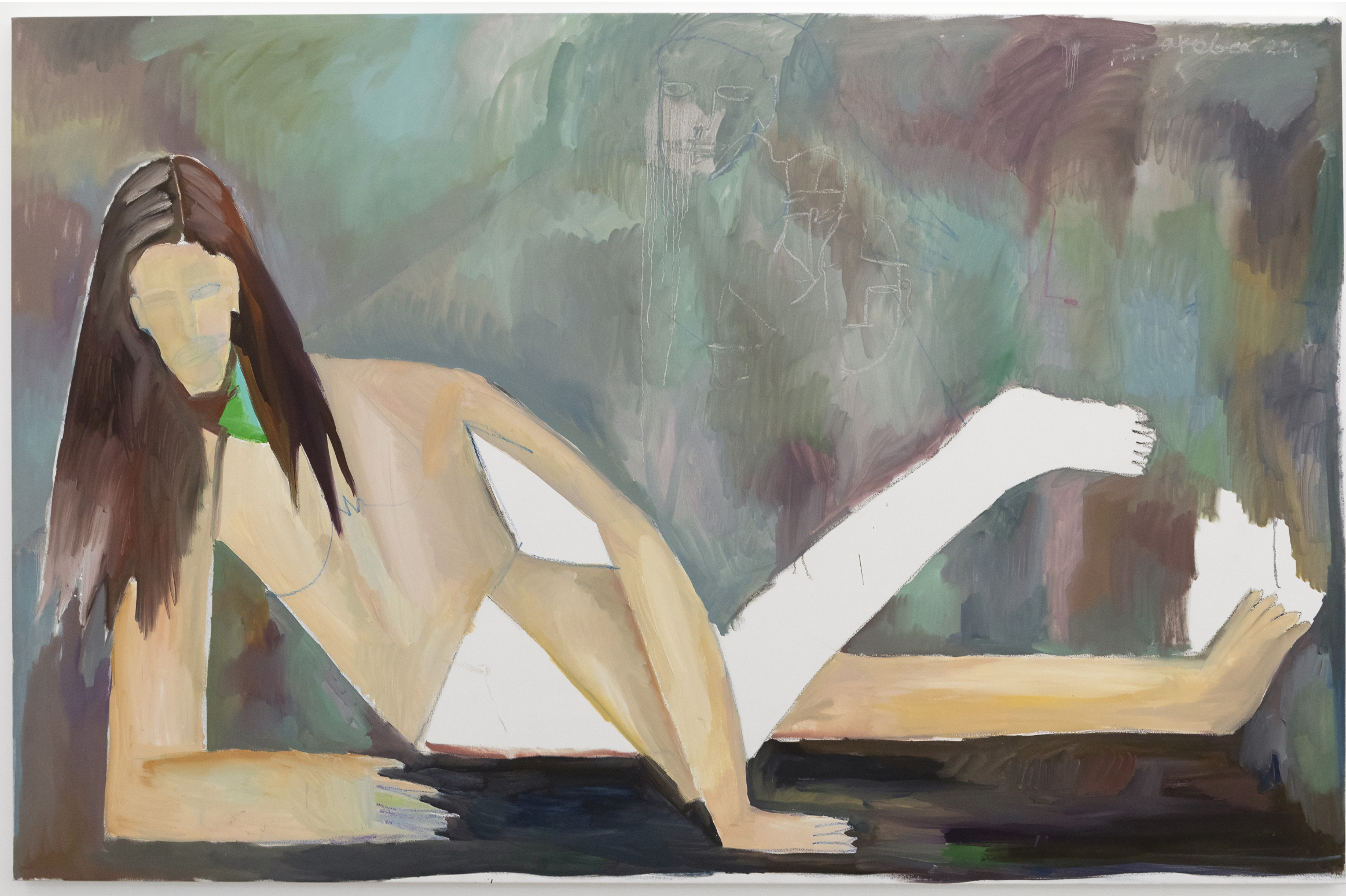
Olympia, 2024, huile et pastels gras sur toile, 147 x 226 cm