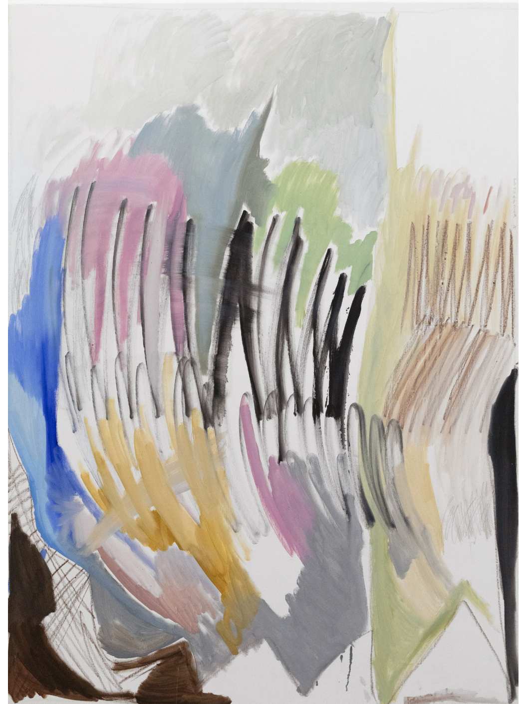
Le Printemps, diptyque, 2024, huile et pastels gras sur toile, 155x116 cm