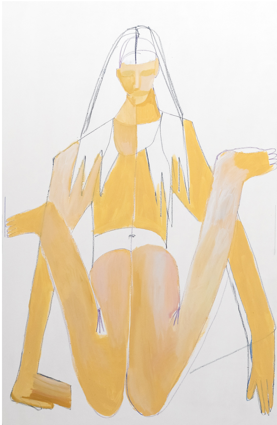
L'été, diptyque, 2024, huile et pastels gras sur toile, 195x124 cm