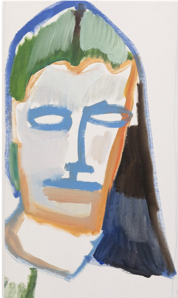
Petit Portrait 01, diptyque 2024 huile et pastels gras sur toile 47x27cm