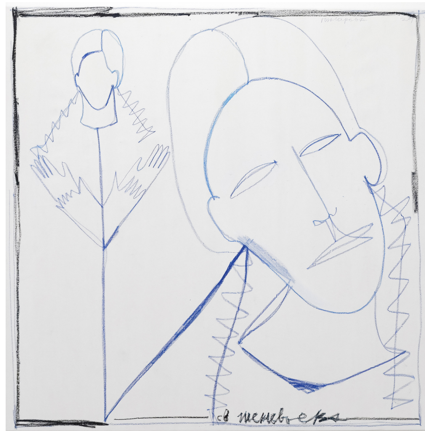
Sainte Geneviève, 2024, pastels gras sur toile, 155x155 cm